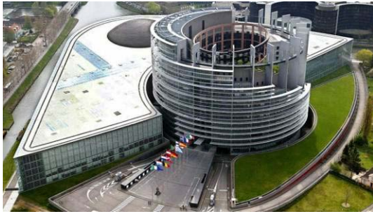
Consejo de Europa en Estrasburgo