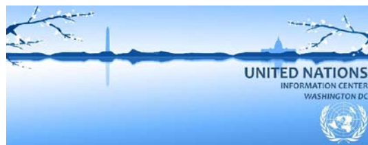
ONU en Washington