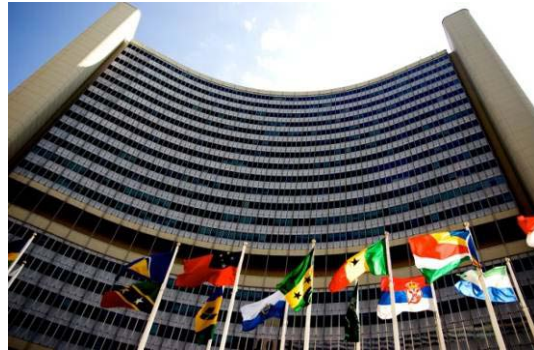
ONU in Viena