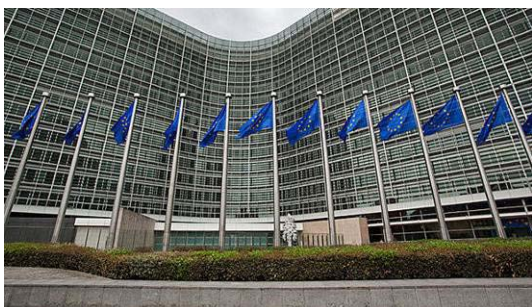
UE en Bruselas