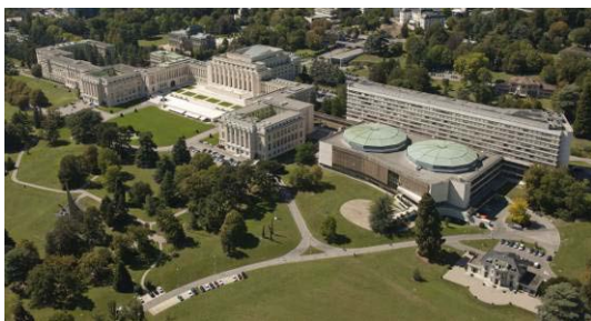
ONU in Ginebra