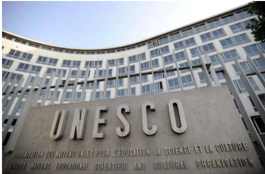
UNESCO en Paris