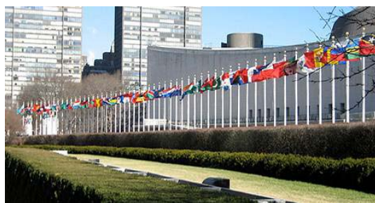
ONU en New York