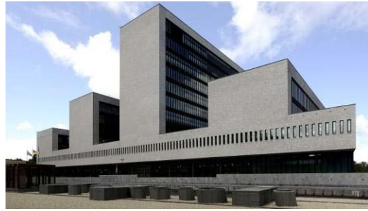
EUROPOL en La Haya